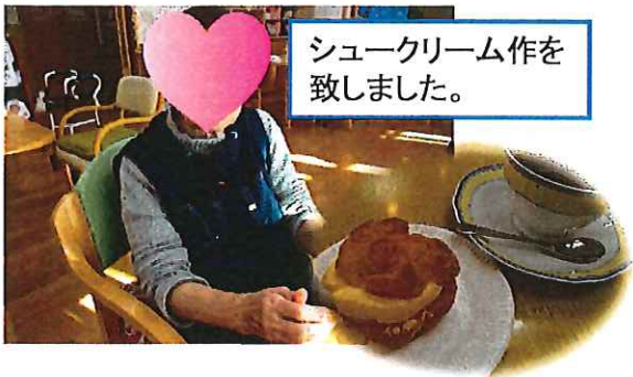
シュークリーム作を 致しました。

明けましておめでとう御座います。 今年も皆様が楽しく安全に芙蓉の園を利用出来るように職員一同 気を引き締めて頑張ります。宜しくお願い致します。